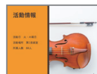
スライド資料の作成