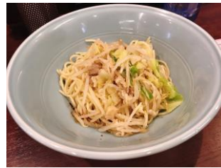
早稲田といえば油そば!

新聞やテレビ、ネットなど様々なメディアについて学んでいます。メディアに対する見方が変わるだけでなく、日常生活でも役立つ知識を得ることができます。パソコンでノートを取る人もいますが、私は手書き派です!