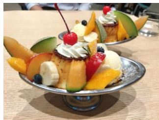
季節によってフルーツが変わります!

友達とカフェ巡りをしています。この写真は最近食べたプリンアラモードです!流行りのお店も良いのですが、昔ながらの隠れ家的な喫茶店が好きです。