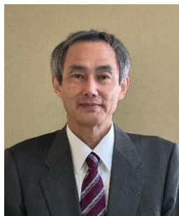
早稲田大学生生活協同組合