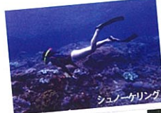
シュノーケリング