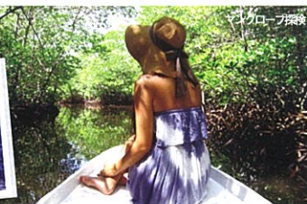
マングローブ探検