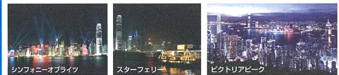
シンフォニーオブリイト