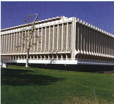
学校外観/イメージ