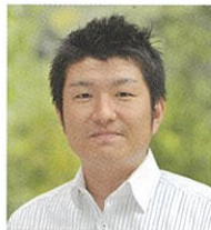
早稲田大学職員 人事部人事課