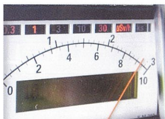
吉沢牧場入口線量 (今回最も線量の高かった地域)