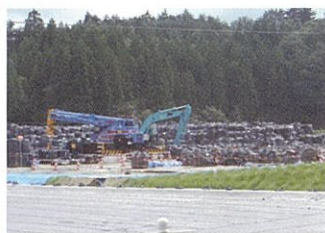
南相馬除染の様子