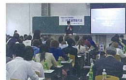
昨年は総代150名中143名(実出席45名)の出席でした。