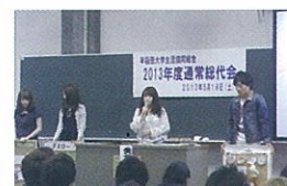
共済給付ボードのとりくみを発表する学生委員